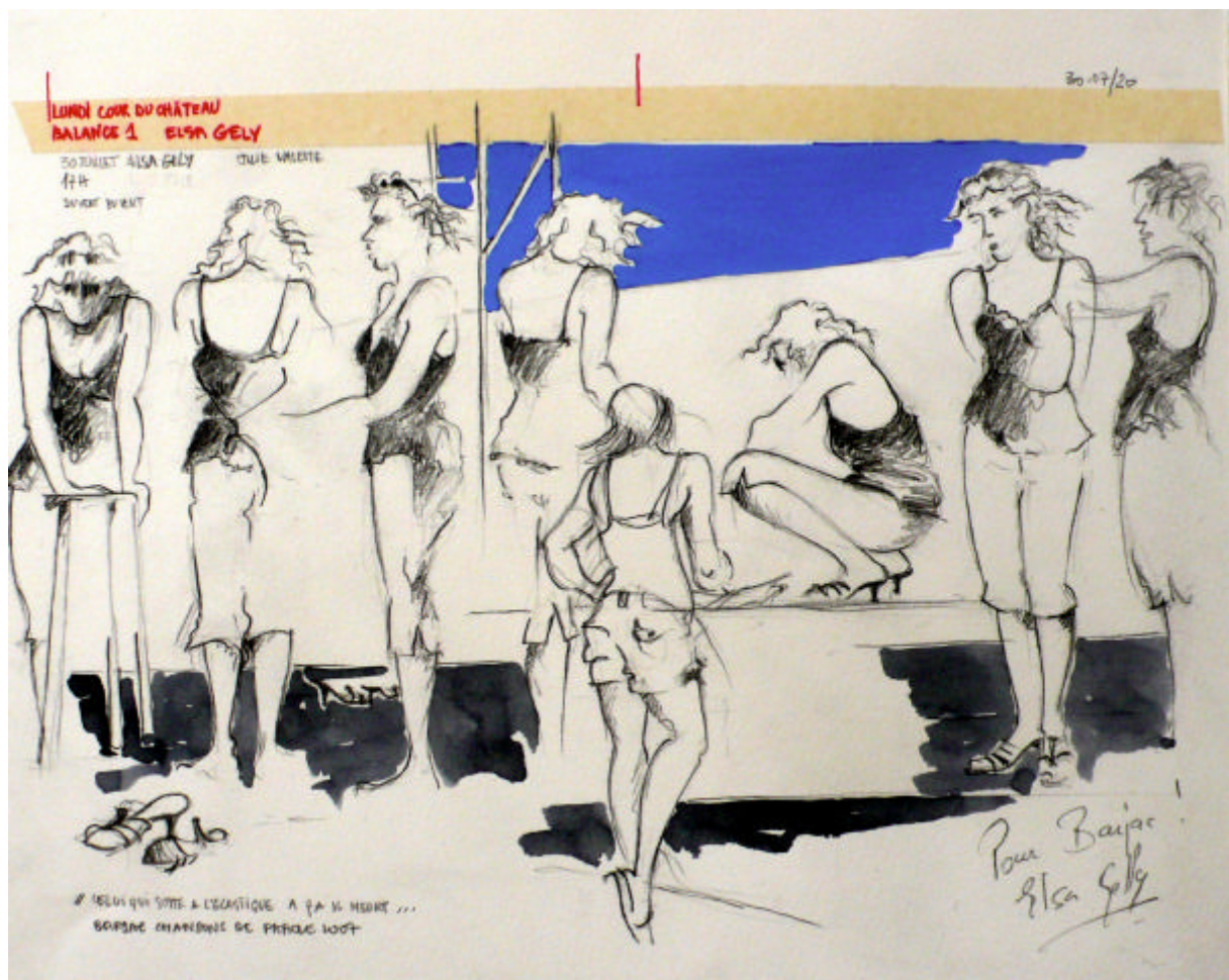
Festival chanson de Paroles - Barjac 2007