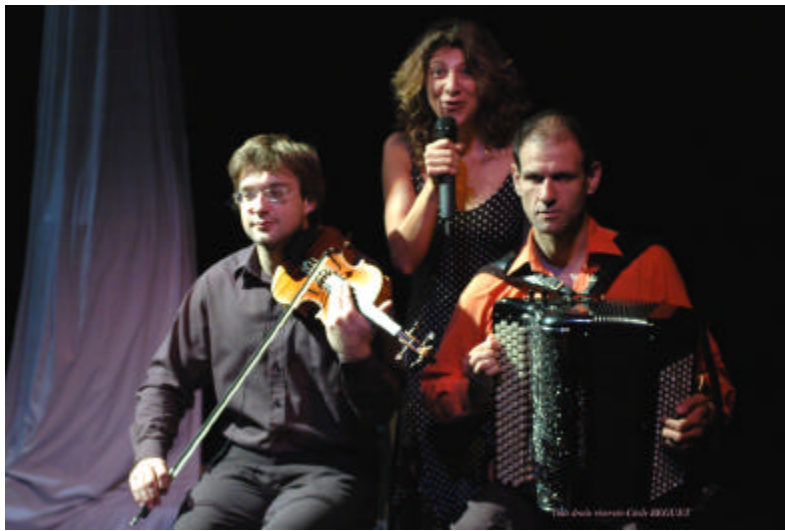
Larguez les amours